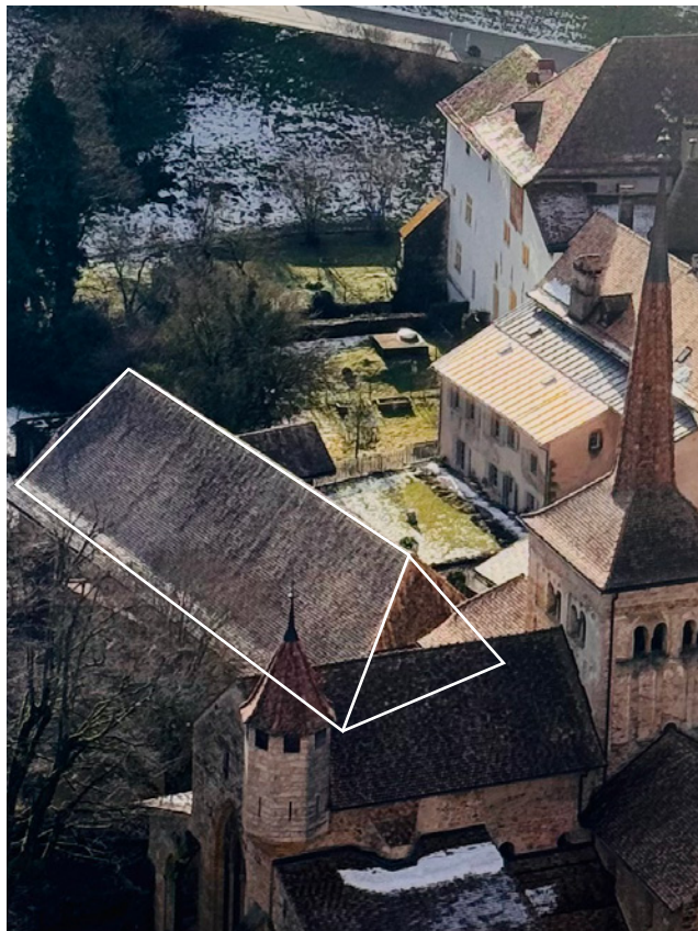
Maison des Moines et cour du Cloître

L'installation s'inscrit dans le sillage de la Via Francigena, l'ancienne route historique et chemin de pèlerinage reliant Canterbury à Rome. Empruntée dès le Moyen Âge par les pèlerins-es, marchands et voyageurs (dont l'archevêque Sigéric de Canterbury en 990), cette voie majeure traverse la France, la Suisse et l'Italie et est aujourd'hui reconnue comme un grand itinéraire culturel européen.