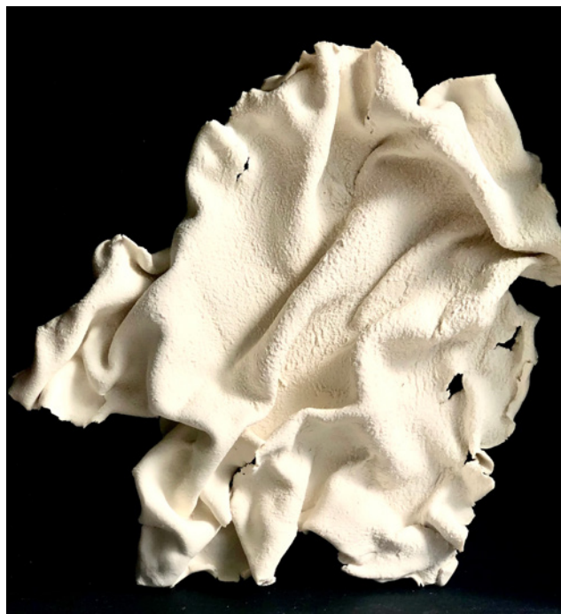
Recherches / porcelaine

Les miroirs recouvrent un pan de mur, en reflétant dans diverses directions et en déstructurant l'architecture, ils soulignent les changements de direction et l'infini des possibles.