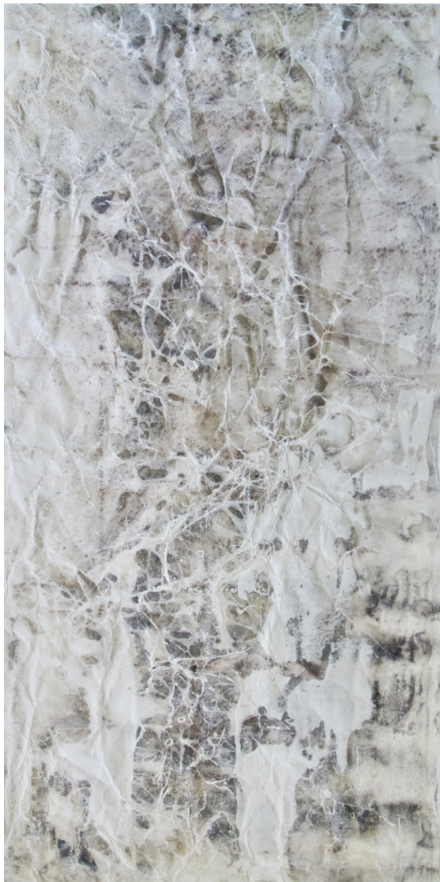
Recherches / papier

En présence de l'écrivain et journaliste Paolo Rumiz , reconnu pour ses ouvrages sur le voyage, les chemins et la figure du pèlerin-e. En collaboration avec le réseau suisse des sites clunisiens.